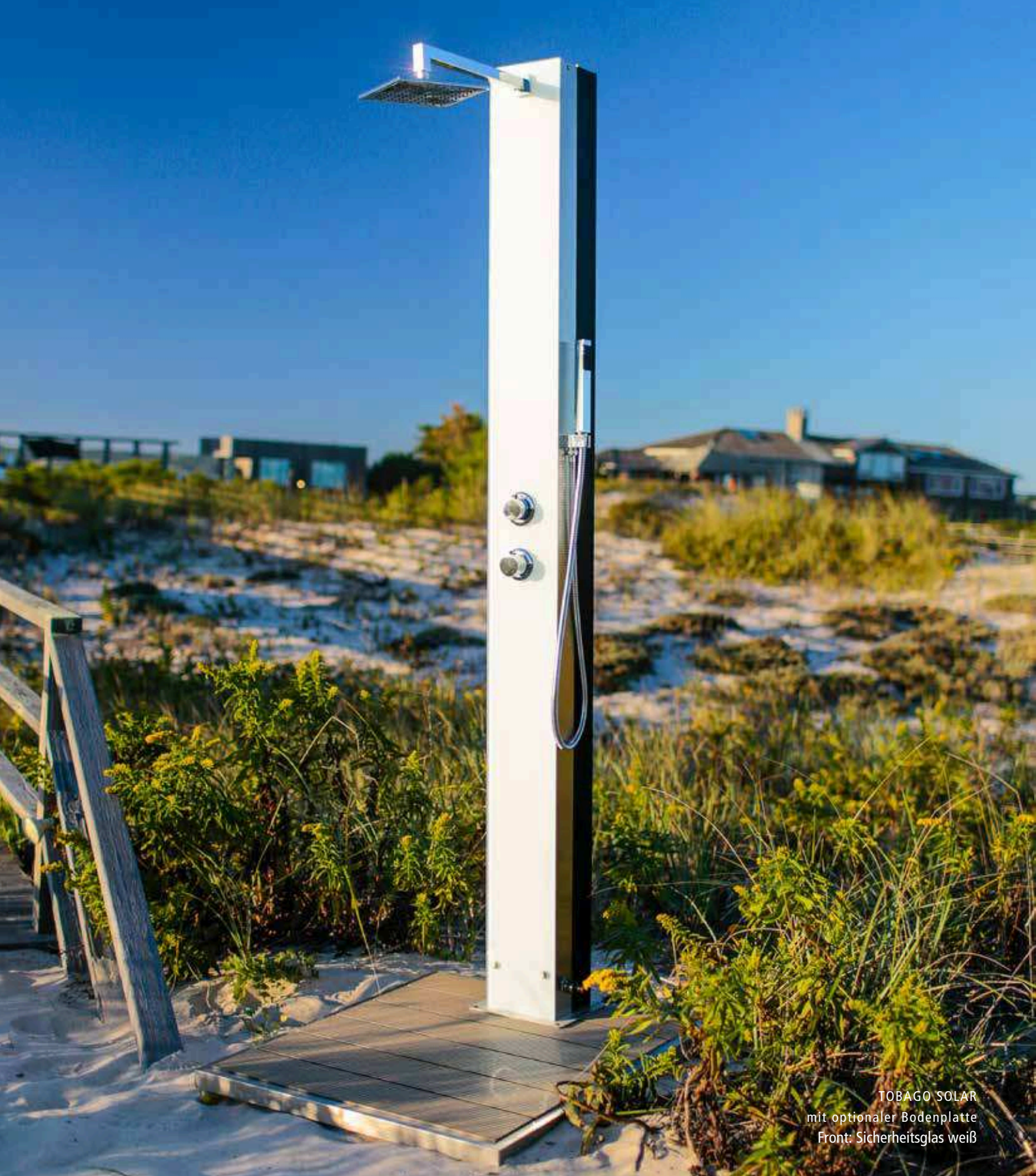
TOBAGO SOLAR mit optionaler Bodenplatte Front: Sicherheitsglas weiß