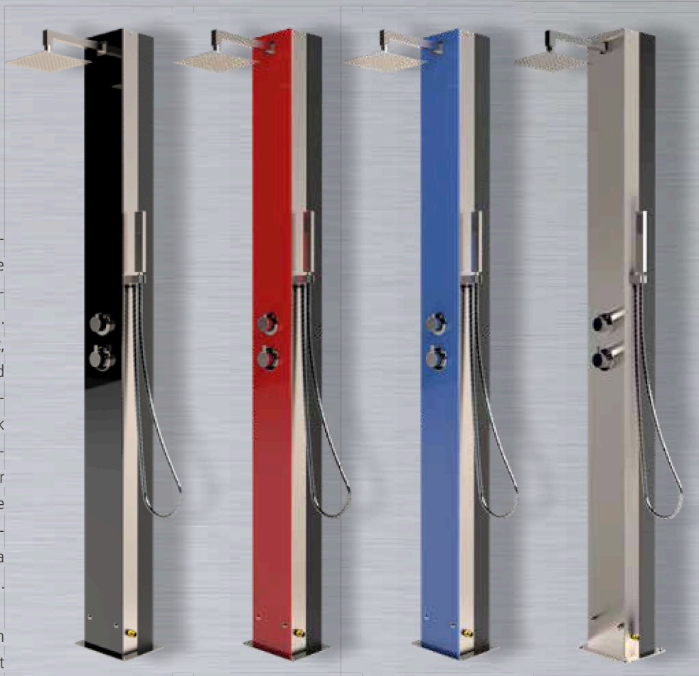
KUBA SOLAR Front: Sicherheitsglas schwarz

Selbstverständlich verfügt jede Solardusche auch über eine Handbrause, die getrennt angesteuert werden kann. Jetzt kann die Sonne kommen.